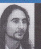
サルバ・テ・マリア