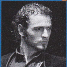
クリスティアン・ロサーノ